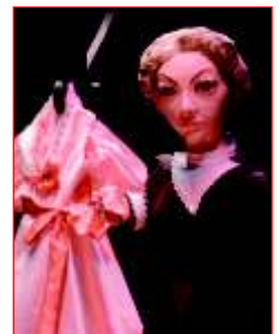
Avoa de Mina