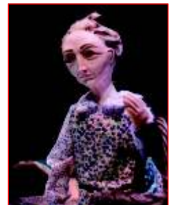
A vella dos chicharos