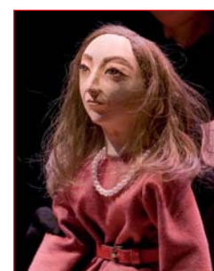
Madre de Mina