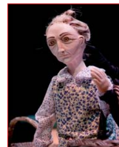
La vieja de los chícharos