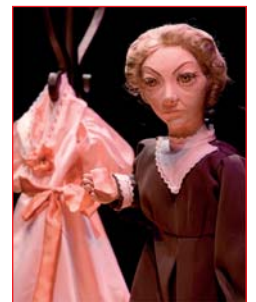
Abuela de Mina